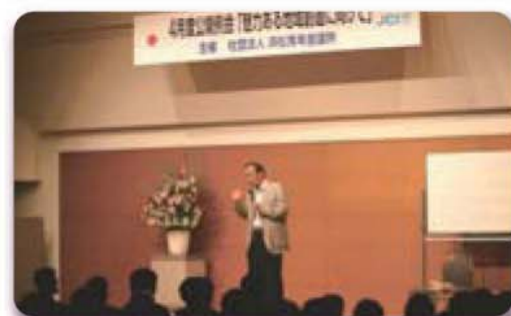
4月度公開例会 「世界で1番受けたい授業」