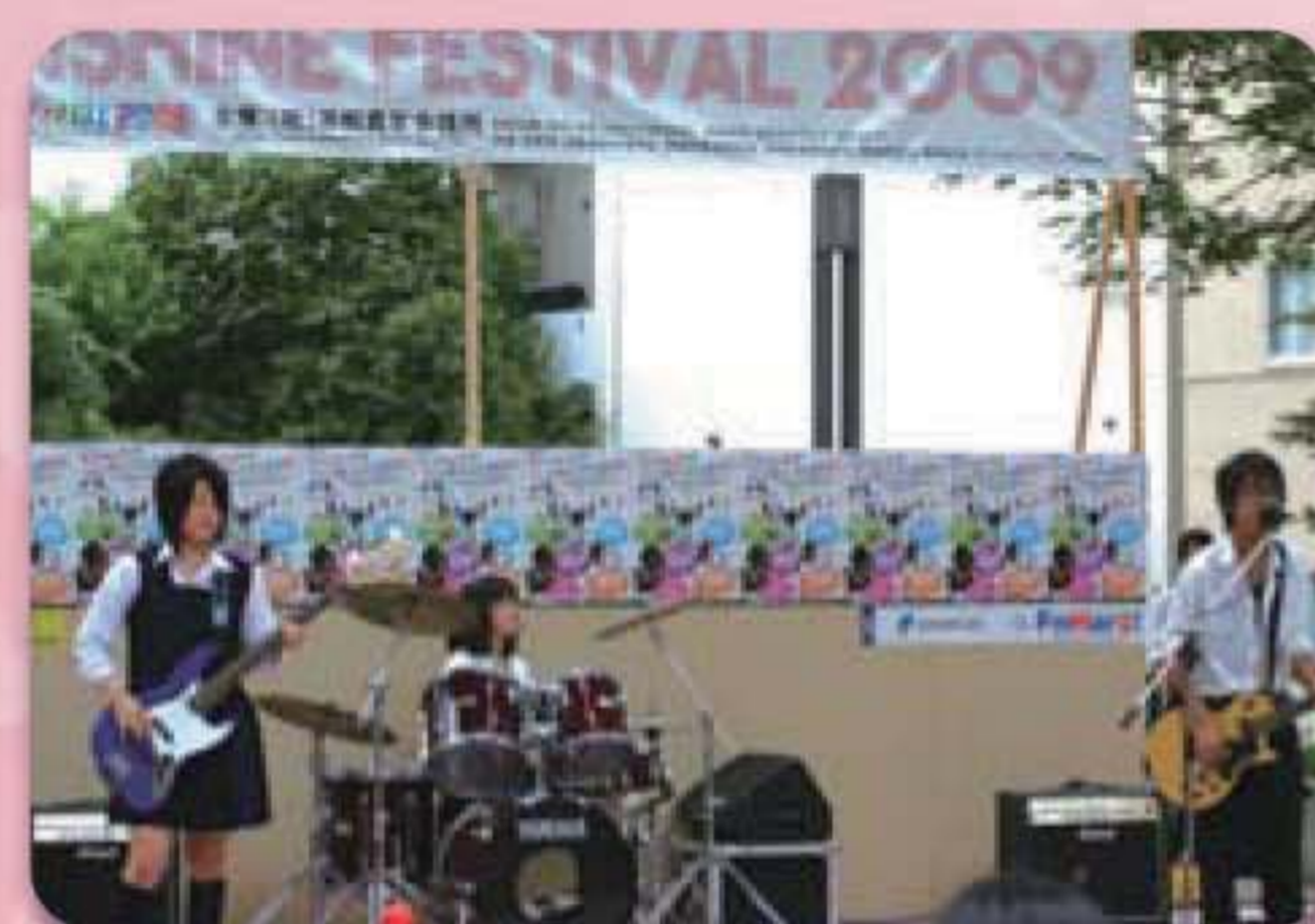
サンシャインフェスティバル

浜松の特徴である音楽文化を通じ、人々の心に勇気や感動を与える目的で、我々浜松JCによって設立された市民参加型の劇団。