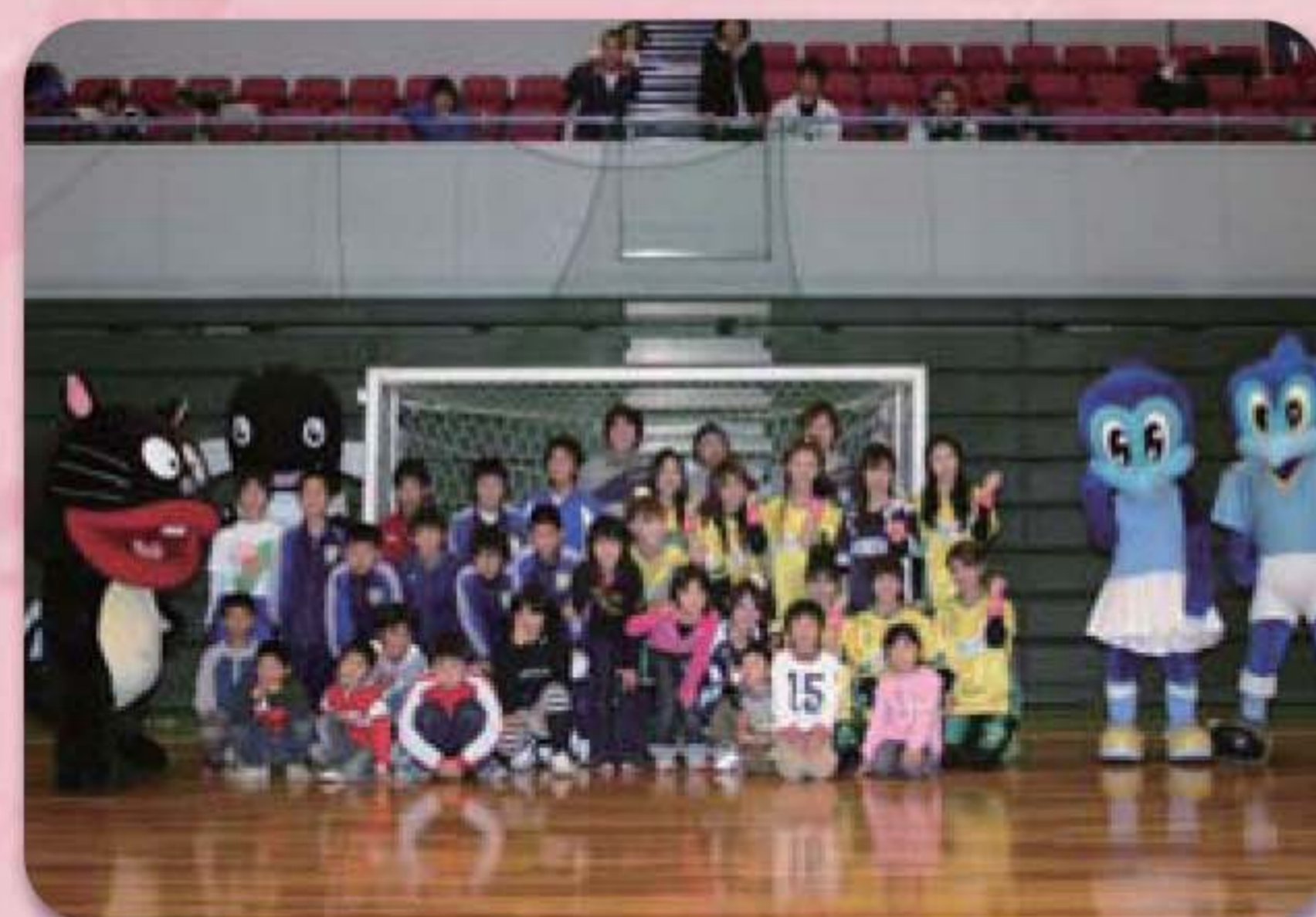
0-30 Ladies オーバーサーティーレディーズ フットサル大会inはままつ