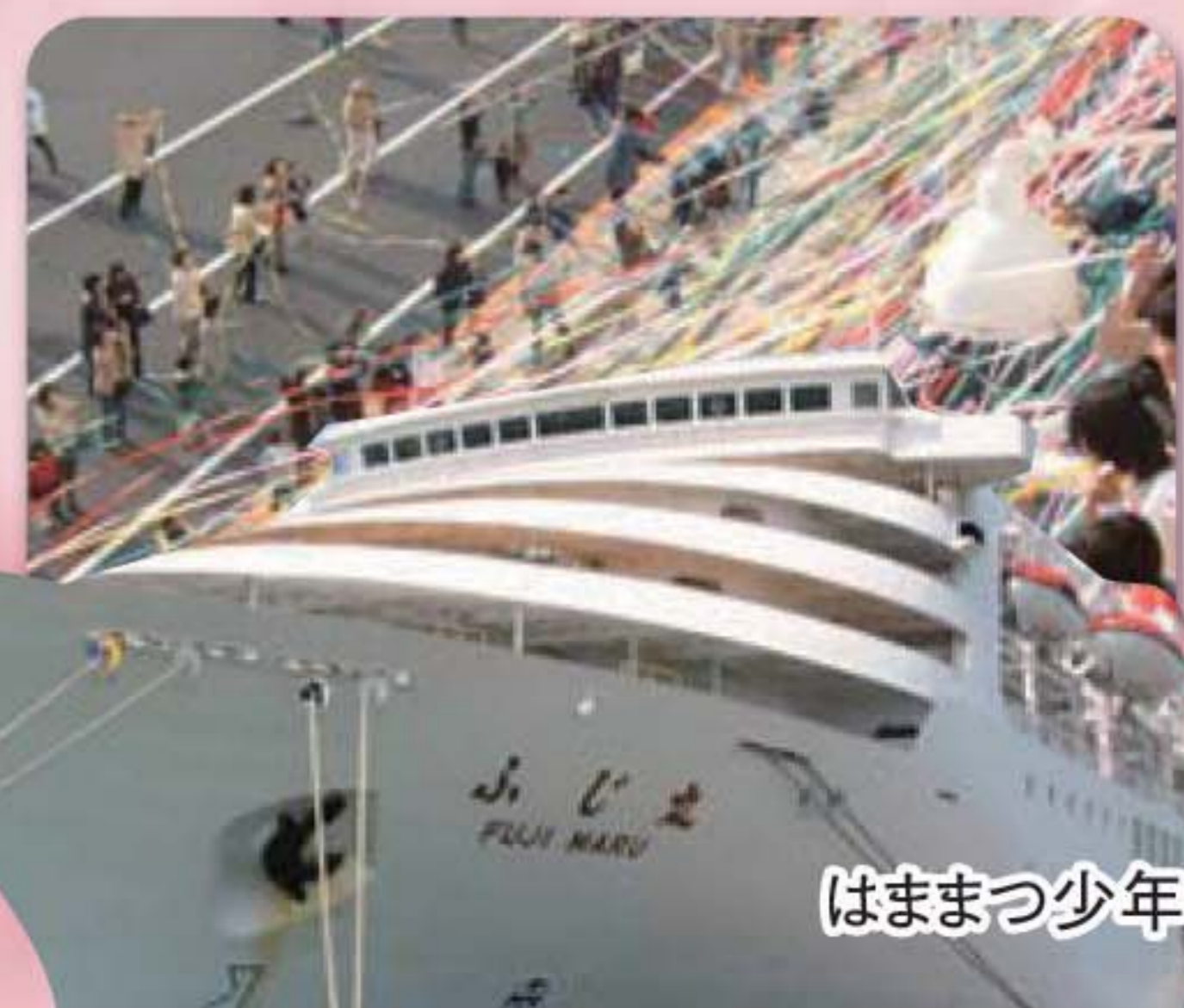
はままつ少年の船