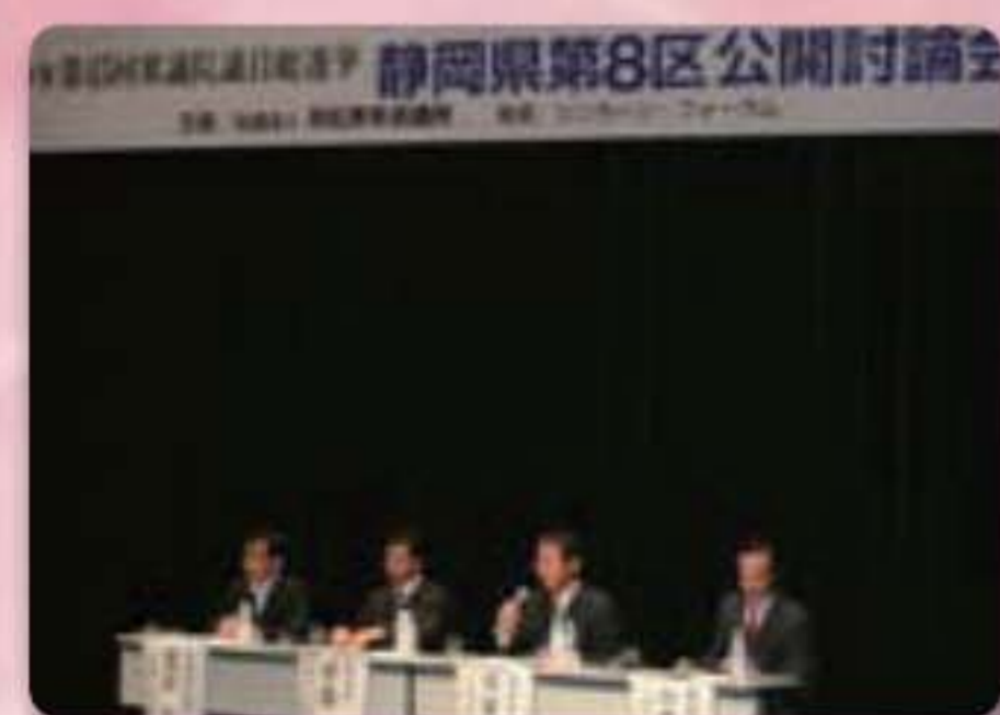
衆院選公開 討論会