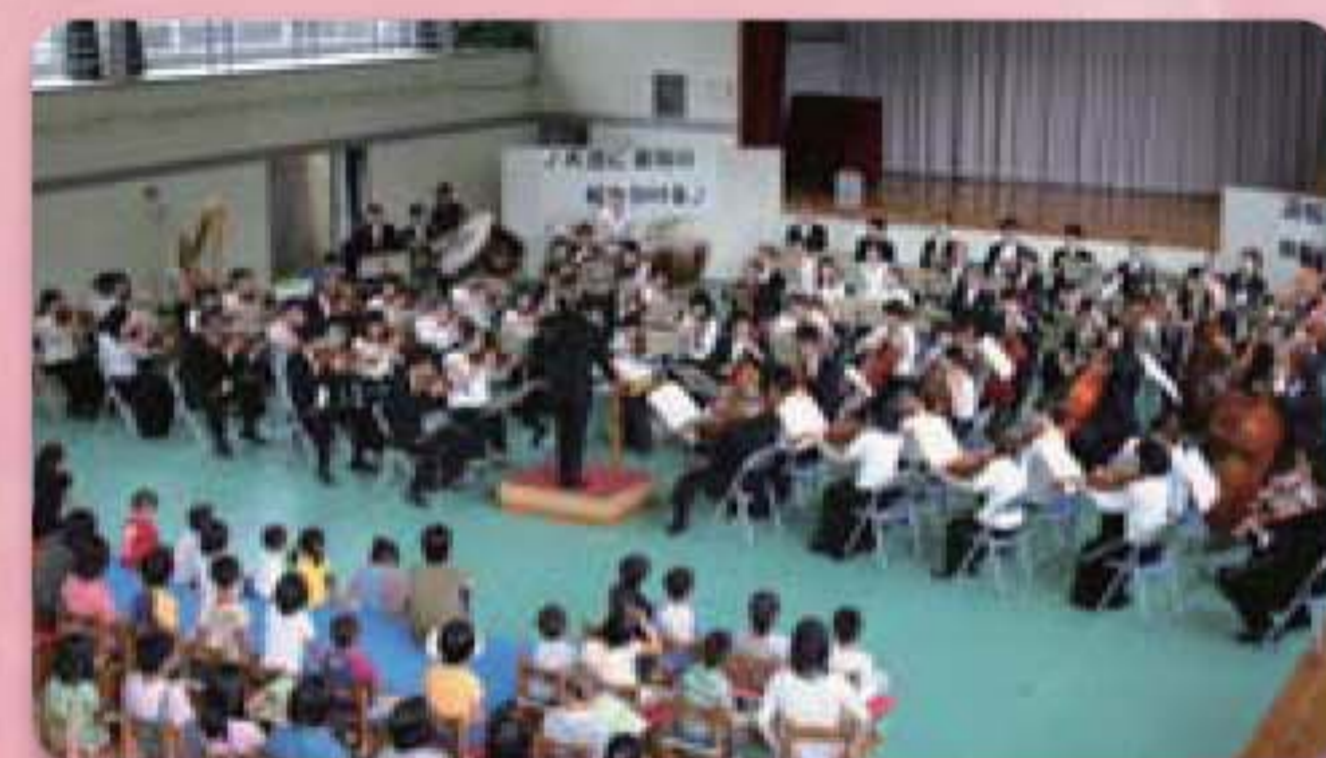
移動オーケストラ教室